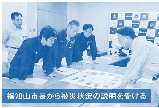
福知山市長から被災状況の説明を受ける