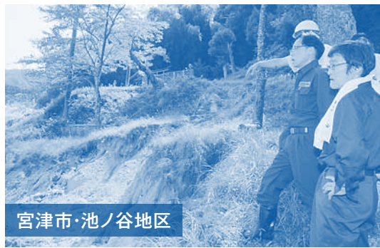
宮津市・池ノ谷地区