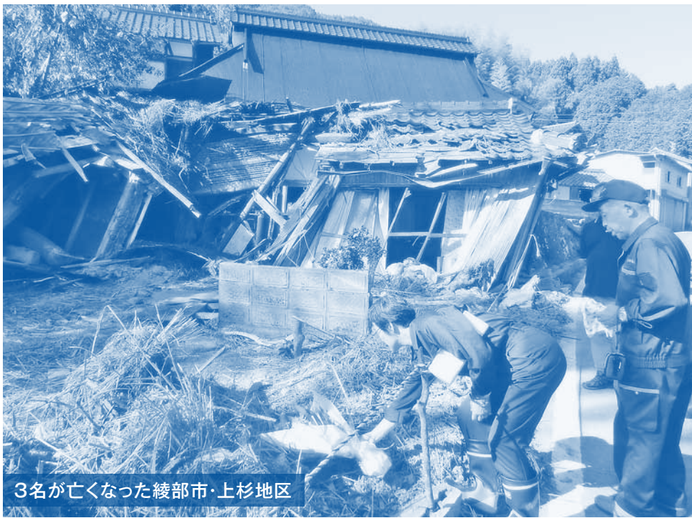
3名が亡くなった綾部市・上杉地区